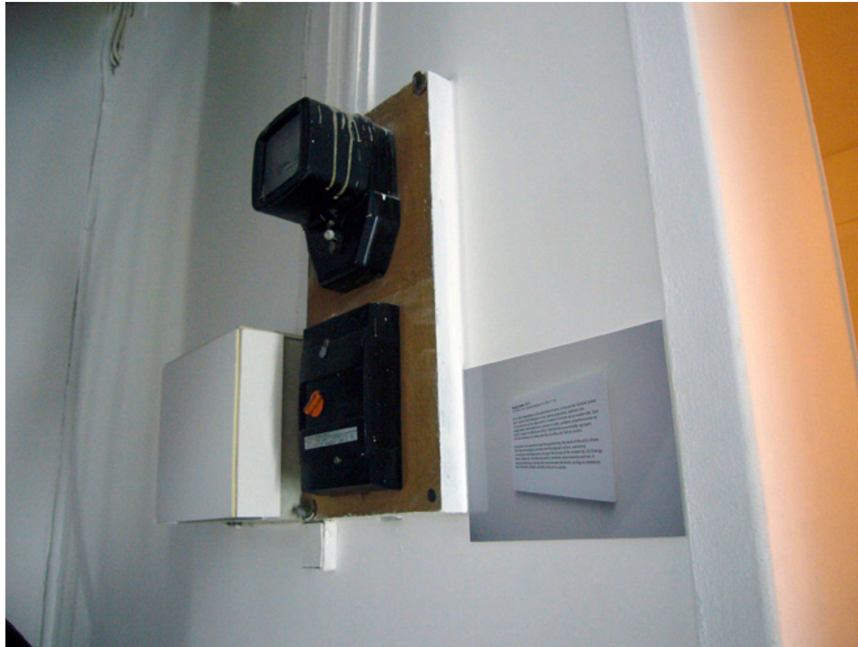
Hubert Renard, The Exhibition of The Space From Below , L'espace d'en bas, Paris, 2010 CARTEL : Energy meter , 2010