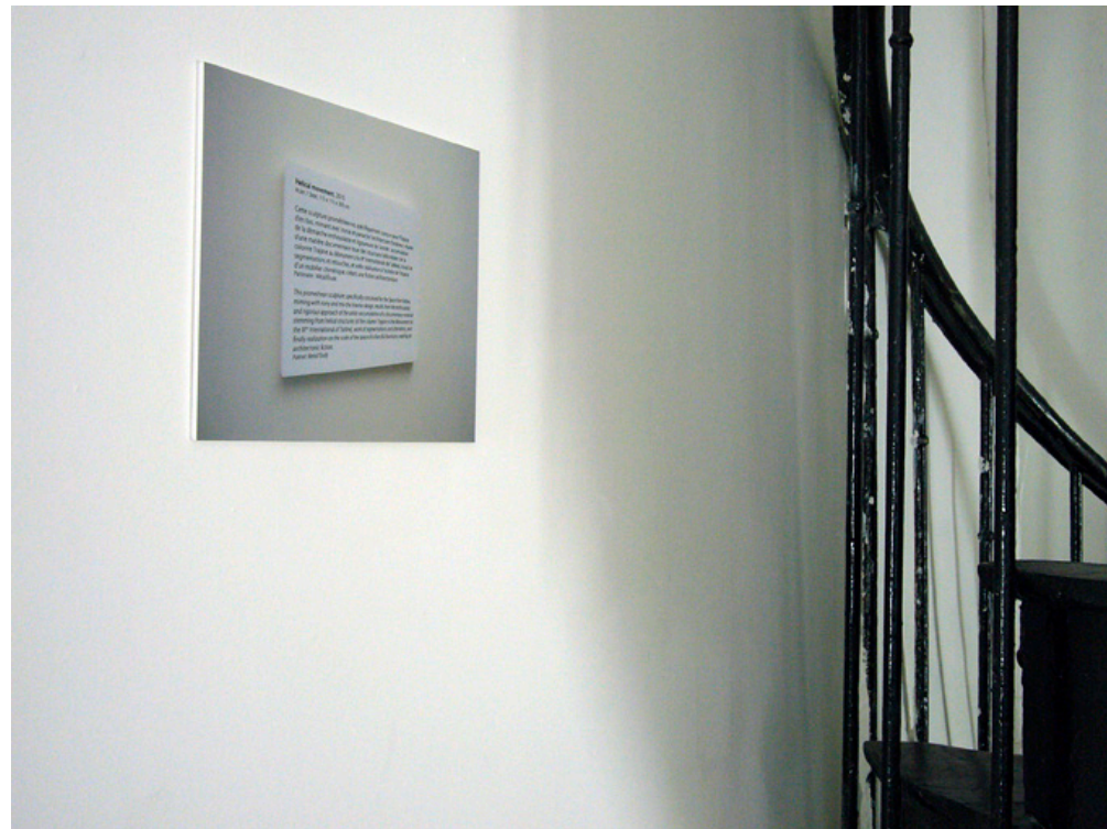
Hubert Renard, The Exhibition of The Space From Below , L'espace d'en bas, Paris, 2010