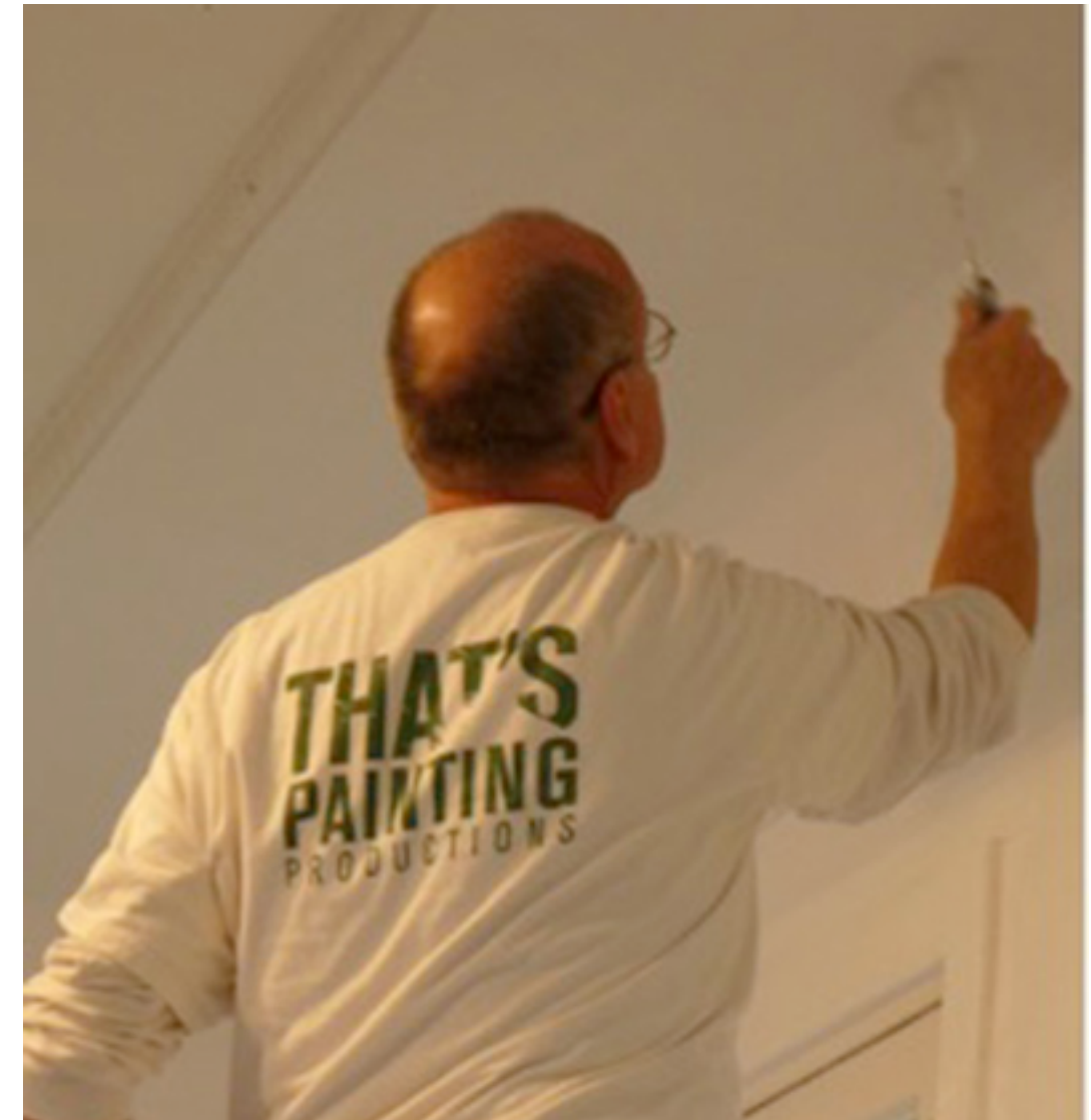
Blanc mat, Galerie Villa des Tourelles, Nanterre, 2014, photo Églantine Laval

That's painting se propose de faire face à tous vos besoins de peinture, que ce soit dans une construction neuve ou sur un projet de rénovation. Forts de plus de vingt-cinq ans d'expérience, nous sommes prêts à vous conseiller sur les choix de type de peinture, de couleur, ou de brillance adaptés à votre situation spécifique.