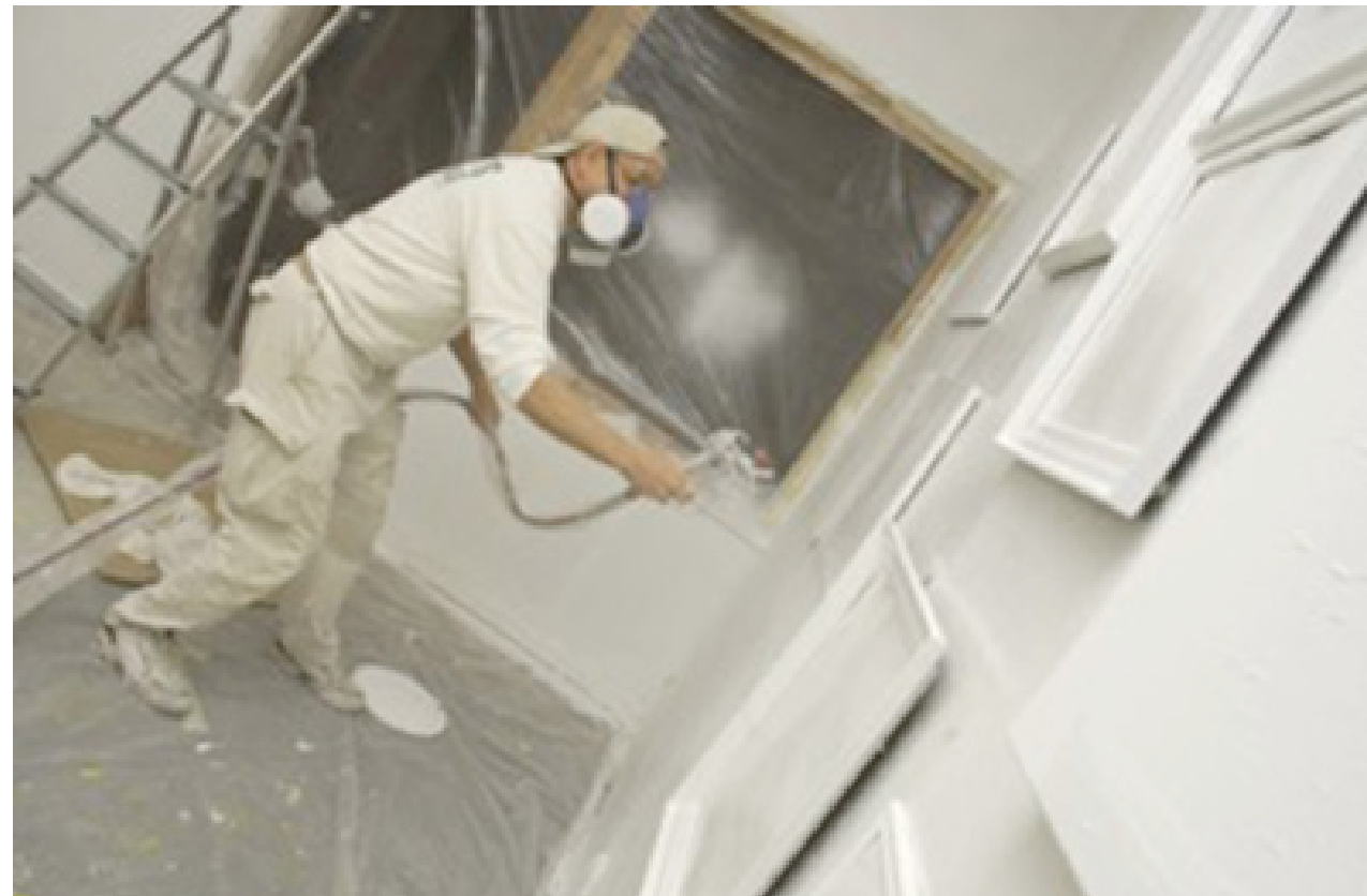
White Wash, Ecole du Baoom, Grenoble, 2007