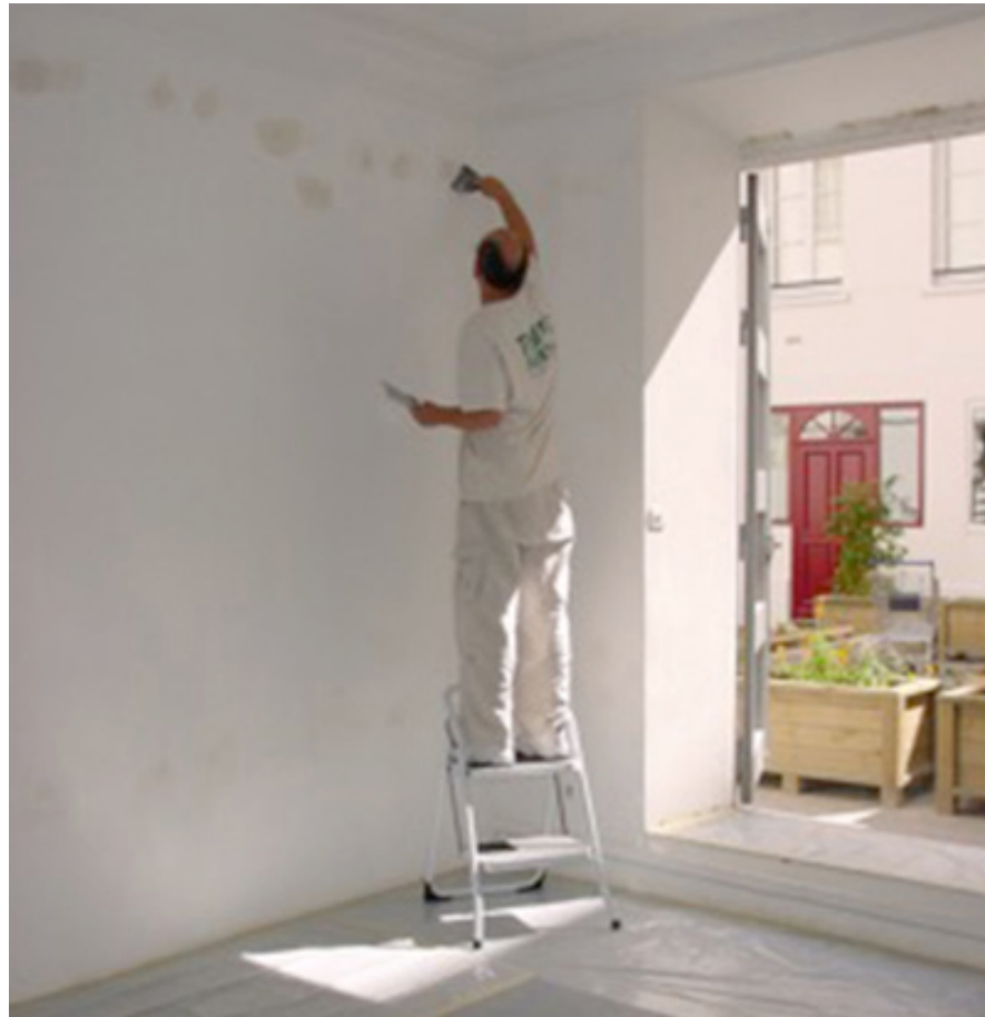
That's Painting Productions, Galerie Le Sous-sol, Paris, 2002